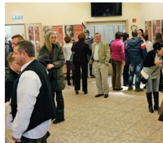
A kiállítás és közönsége

A kiállításon március 6-ig 19 értéket tekinthettek meg az érdeklődők. Épített környezet kategóriában: Keresztelő Szent János katolikus templom, református templom, vasútállomás épülete, helytörténeti gyűjtemény (épület, kiállítás, udvar).