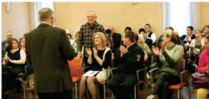
A taps Csík József gerelyhajító-bajnoknak szól

Február 17-én, 16 óra-kor nyitották meg az érdeklődők előtt az Üllői Települési Értéktár Bizottság eddigi gyűjtőmunkáját felölelő Üllői Értékek című kiállítást.