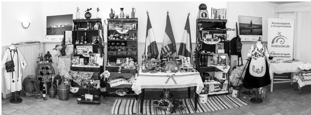
Hatvan értéket számláló hungarikum gyűjteményt mutattak be a Kiss Sándor Művelődési Házban

A Bóbita Tagóvoda hetedik jótékonyági báljára február 25-én, a hungarikumok jegyében került sor a Kiss Sándor Művelődési Házban.