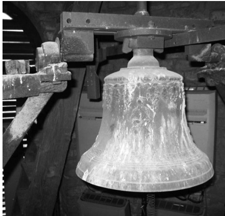
Keresztelő Szent János római katolikus plébániatemplom lélekharangja

K ubinyi Endre (1858–1939) Kecskeméten született 1858. október 30-án. Iskoláit szülővárosában Kecskeméten, valamint Kassán és Vácott végezte. 1881. július 16-án szentelték pappá. Magyaránadorban (1881), Bagon, Heréden, Tápiógyörgyén, Rékason és Cegléden mint káplán szolgált. 1885-től Vácott élt, karkáplánként. 1889-ben a váci Ipari- és kereskedelmi iskolák majd az Istvántelki Kertész-képző Intézet igazgatója volt. A váci Legényegylet elnökeként is tevékenykedett. Öt évig volt a püspöki templom hítszónoka. 1891–1902-ig Rétságon volt plébános. Itt új harangot önttetett és évente egy darab 10 koronás arannyal támogatta a nőgrádi járáskör tevékenységét. Tóalmási éve alatt tantermet építtetett. 1902-ben üllői plébánossá nevezték ki. Munkássága alatt indultak meg a Keresztelő Szent János római