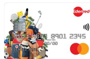
Edenred Komfort kártya