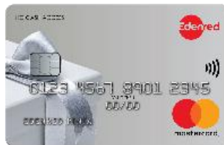
Edenred Ezüst kártya