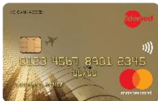
Edenred Arany kártya